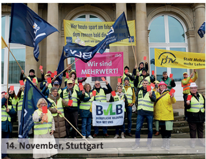
14. November, Stuttgart