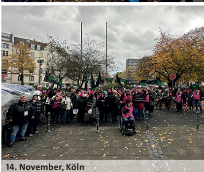
14. November, Köln