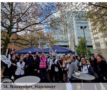
14. November, Hannover