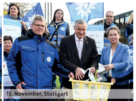
15. November, Stuttgart