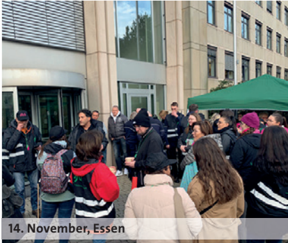
14. November, Essen