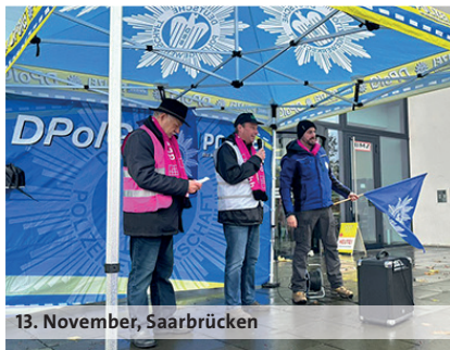
13. November, Saarbrücken