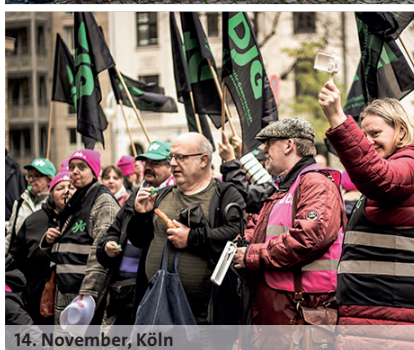
14. November, Köln