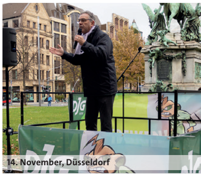
14. November, Düsseldorf