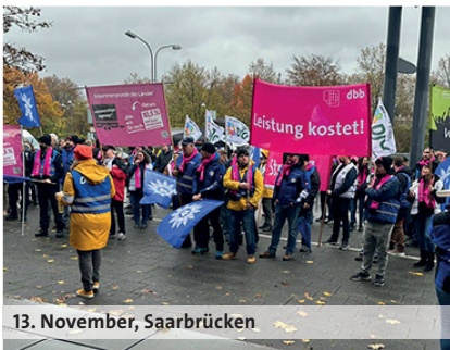
13. November, Saarbrücken