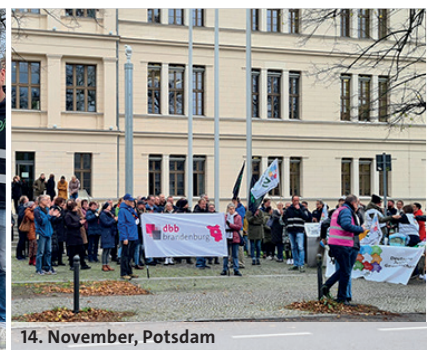
14. November, Potsdam