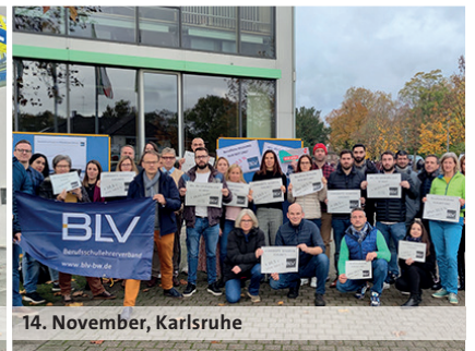
14. November, Karlsruhe

nen als im Land Hamburg, wird diese nicht verstreichen lassen.“ Zudem sei die Anpassung des Entgelts eine Frage der Wertschätzung. Das gelte auch für Beamtinnen und Beamte, sagte Treff und unterstrich die Erwartung der Gewerkschaften, das Tarifiergebnis zeitgleich und systemgerecht auf den Beamtenbereich sowie Versorgungsempfängerinnen und -empfänger zu übertragen.