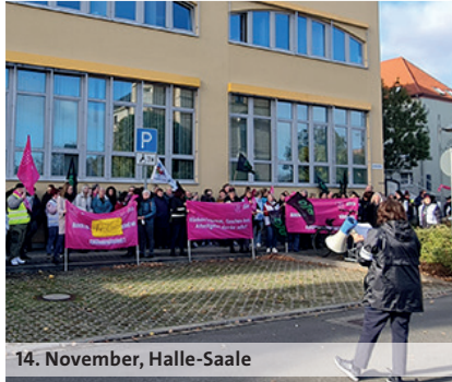
14. November, Halle-Saale