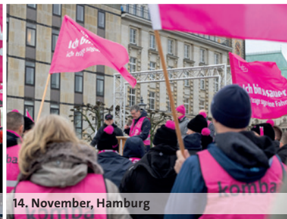
14. November, Hamburg