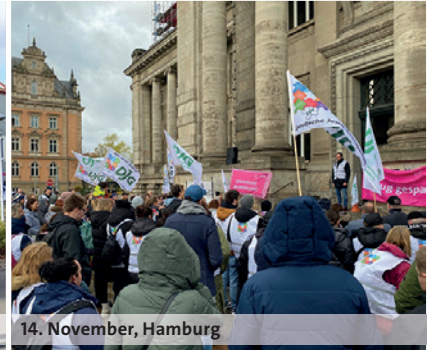
14. November, Hamburg

die guten Leute, die wir haben, vor der Zeit, und der Nachwuchs, den wir dringend brauchen, kommt erst gar nicht. So fahren die Justizverwaltungen letztlich an die Wand!“, sagte Schmidt.