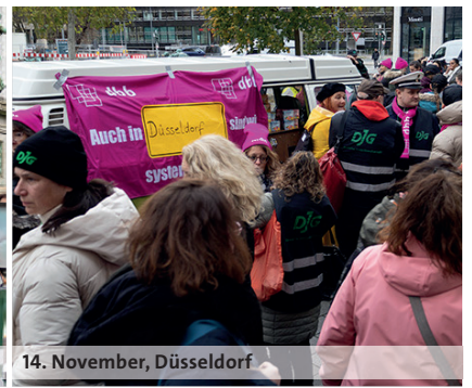
14. November, Düsseldorf