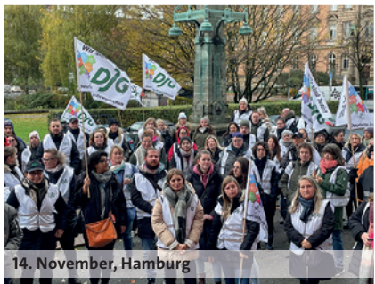
14. November, Hamburg

dbb: wir. für euch. 10,5% 500 Euro mindestens