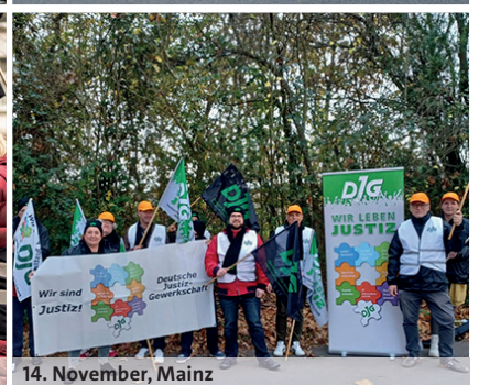
14. November, Mainz