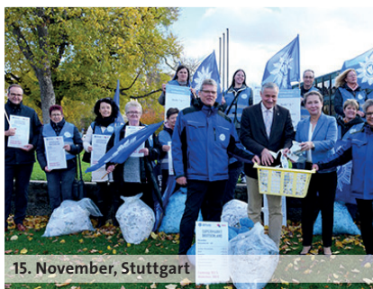
15. November, Stuttgart