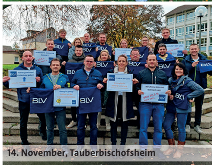
14. November, Tauberbischofsheim