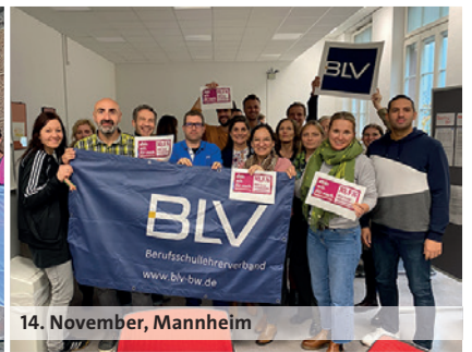
14. November, Mannheim

ten und haben vor dem Justizministerium in Saarbrücken eine Kundgebung durchgeführt. Die mehr als 250 Teilnehmenden haben lautstark gezeigt, dass sie endlich ein Angebot der TdL wollen.