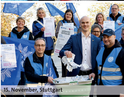
15. November, Stuttgart