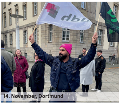
14. November, Dortmund