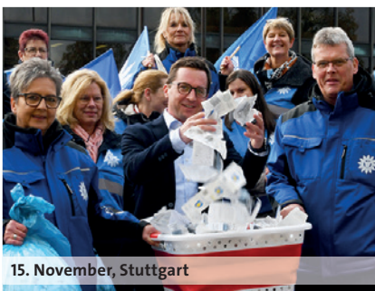
15. November, Stuttgart