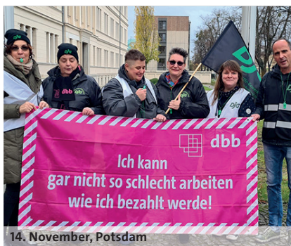
14. November, Potsdam