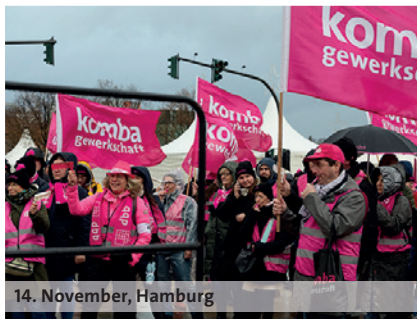
14. November, Hamburg