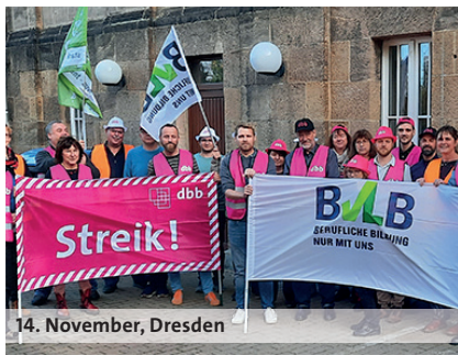
14. November, Dresden